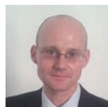
Reinhard Janssen Regierungsdirektor, Bundes- ministerium für Umwelt, Naturschutz, Bau und Reaktorsicherheit