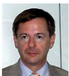
Karl-Heinz Oehler Ministerialdirigent, Bundesministerium der Justiz und für Verbraucherschutz